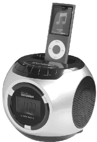
CLOCK RADIO SIP292